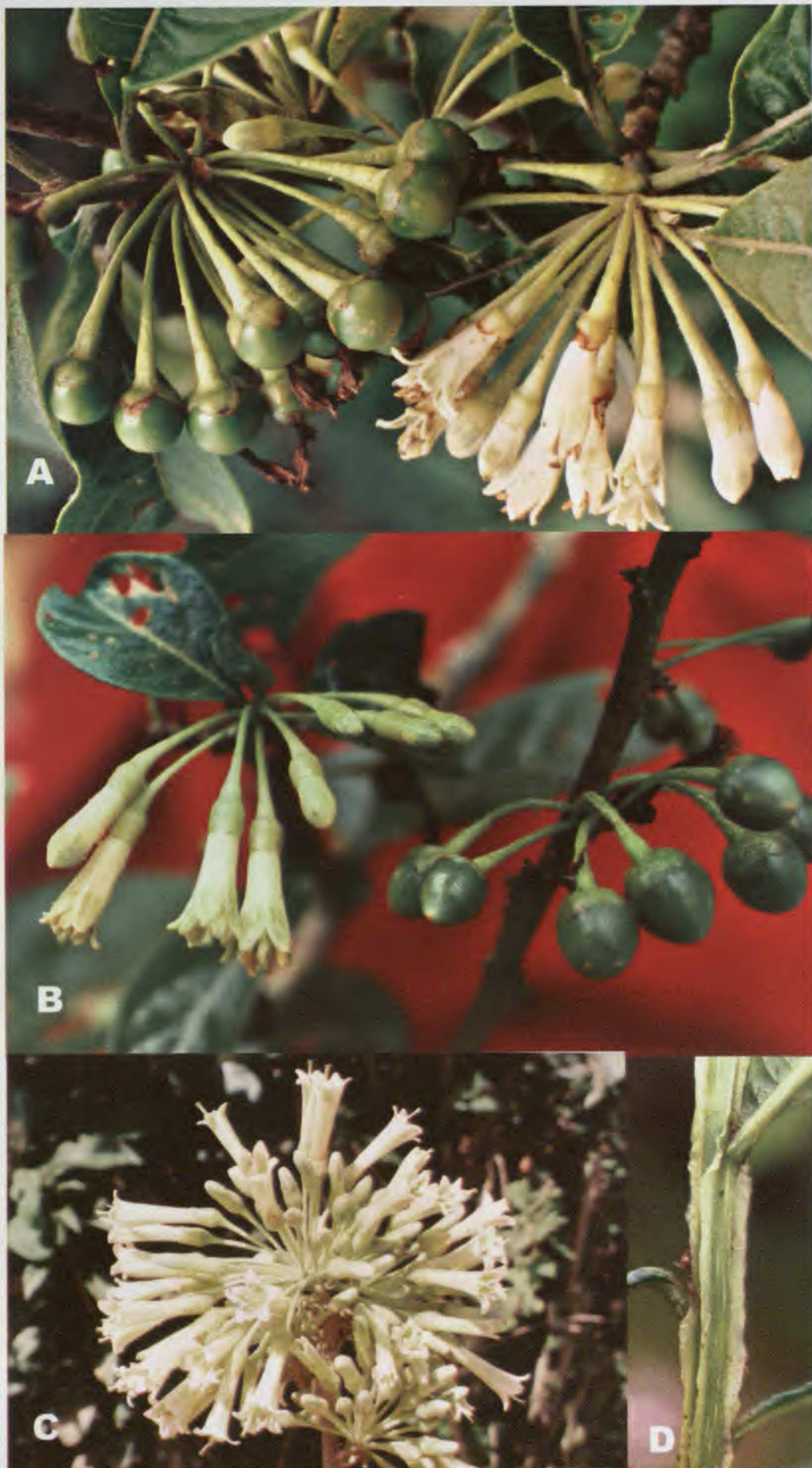
Fig. 2. Iochroma tupayachianum S. Leiva. A. Rama florífera y fructífera; B. Rama fructífera mostrando los tallos sin alas. (S. Leiva G. 3185, HAO). Iochroma confertiflorum (Miers) Hunziker. C. Rama florífera; D. Tallo mostrando las alas (S. Leiva G. 2765, HAO)